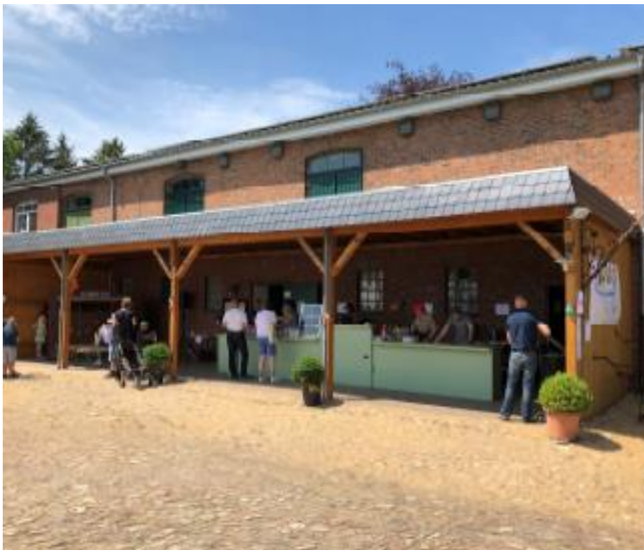
Mölln-Hof mit der volkskundlichen Sammlung

http://www.aktivregion-pinneberg.de/projekte/51-machbarkeitsstudie-erweiterung-des-heimathauses-um-ein-ausstellungsgebaeude-fuer-eine-volkskundliche-sammlung