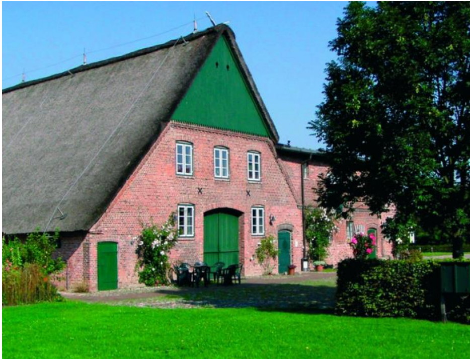
Heimathaus in Tornesch-Esingen